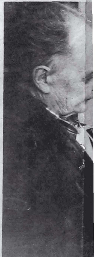
För den kvinnan gör jag honnör, säger I